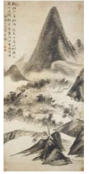
HUA Yan (1682 – 1756) Landscape after the style of Mi Fu hanging scroll, ink on paper, 129.5 x 61cm Gift of the Art Gallery Society of New South Wales 1993 570.1993