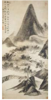
HUA Yan (1682 – 1756) Landscape after the style of Mi Fu hanging scroll, ink on paper, 129.5 x 61cm Gift of the Art Gallery Society of New South Wales 1993 570.1993